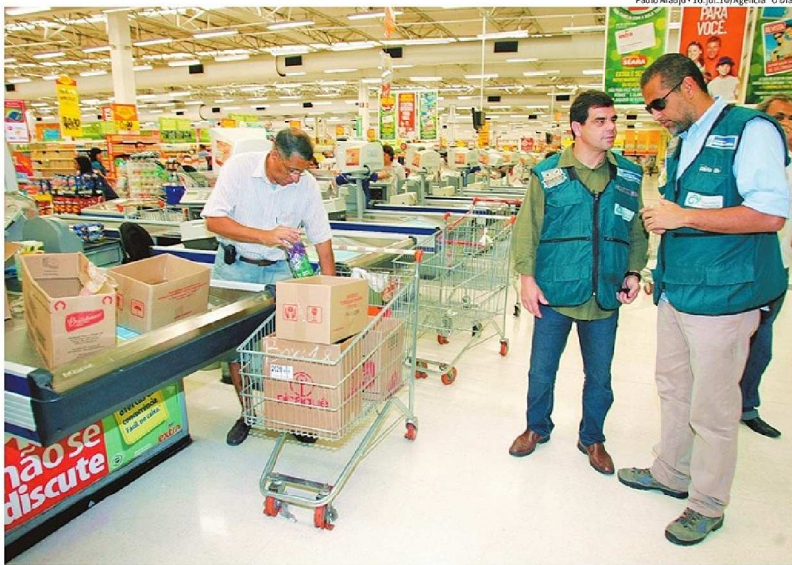
Paulo Araújo - 16.jul.10/Agência "O Dia"

Fiscais verificam o cumprimento de lei fluminense que proíbe a distribuição de sacolas plásticas pelos supermercados